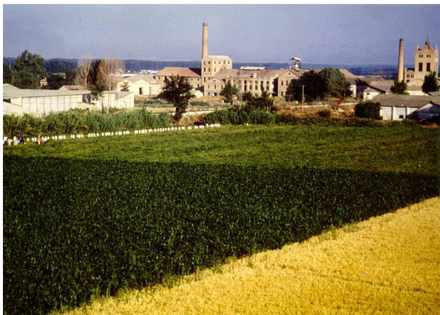
Fábrica Azucarera de San Isidro desde los campos agrícolas de la vega de Granada.