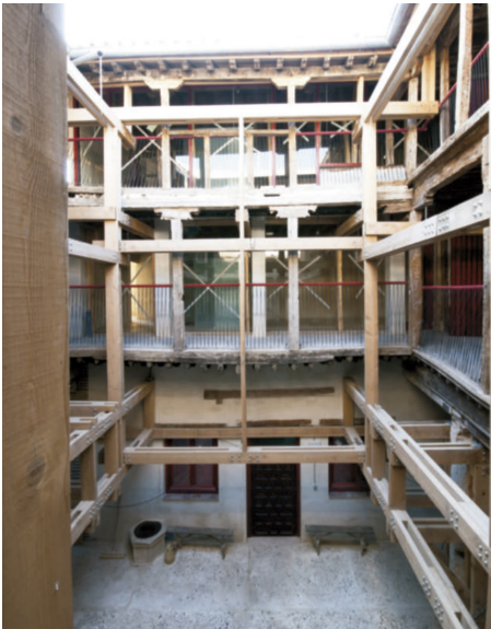
Recuperación de patios en Toledo. Profesores y alumnos de la Escuela de Arquitectura de Toledo. Universidad de Castilla-La Mancha.