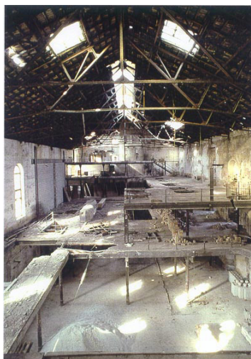
Imágenes interiores de las naves de la Fábrica Azucarera de San Isidro y Torre Alcoholera

- Recuperar un patrimonio industrial reciente, expresión de nuestro tiempo, que formará parte del desarrollo cultural y urbano de Granada. Un proyecto que lidere, junto a otros patrimonios históricos de la ciudad, la candidatura a la capitalidad europea de la cultura 2031, como manifestación de los valores paisajísticos y patrimoniales de nuestra ciudad.