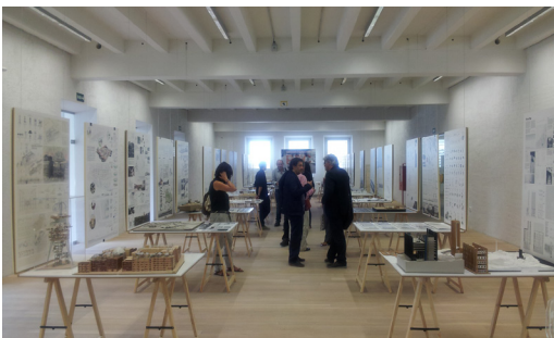
Exposición de Proyectos Fin de Carrera seleccionados por la XIII BEAU en la Escuela Técnica Superior de Arquitectura de Granada (octubre 2016)

XIII BIENAL ESPAÑOLA DE ARQUITECTURA Y URBANISMO