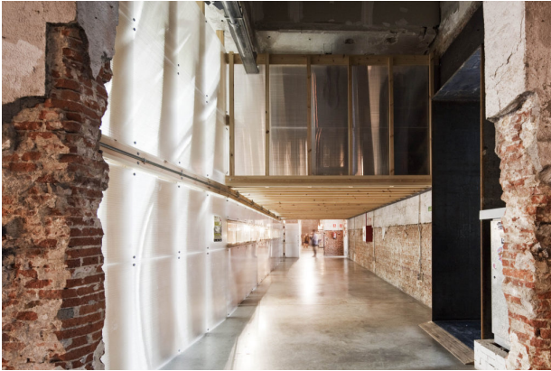
Factoría Cultural Matadero Madrid. Ángel Borrego Cubero, arquitecto.